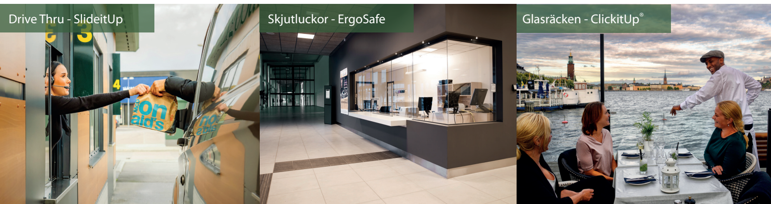
Drive Thru - SlideitUp